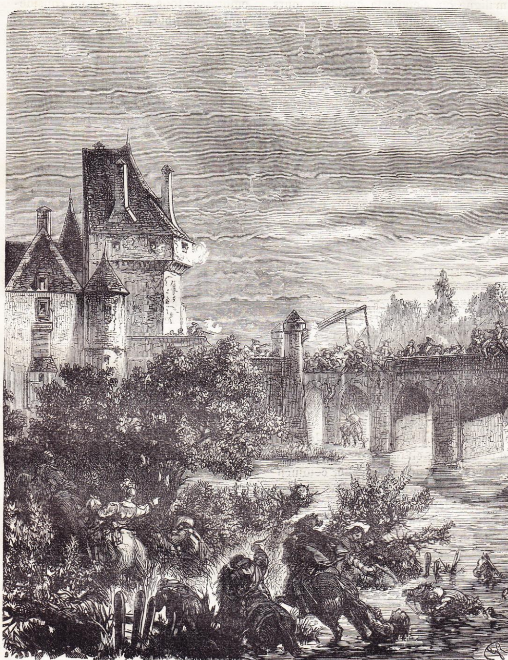
Attaque des Ponts-de-Cé (1620).