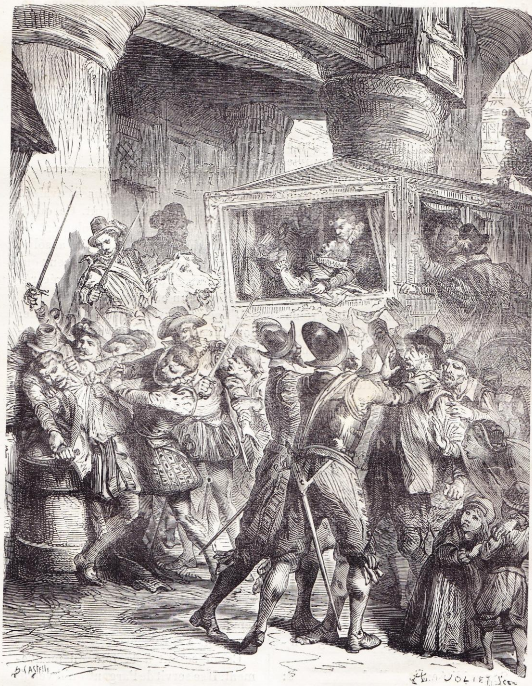
Assassinat de Henri IV par Ravaillac.

parer de Juliers pour les princes protestants.